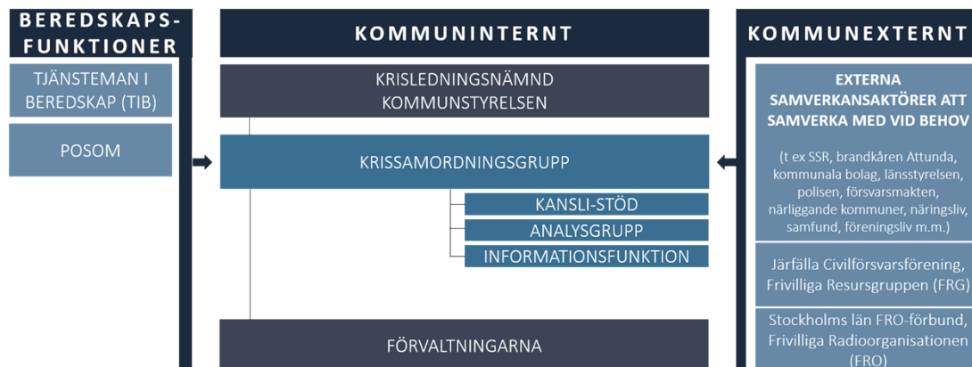
Figur 2: Överblick över Järfälla kommuns krishanteringsorganisation