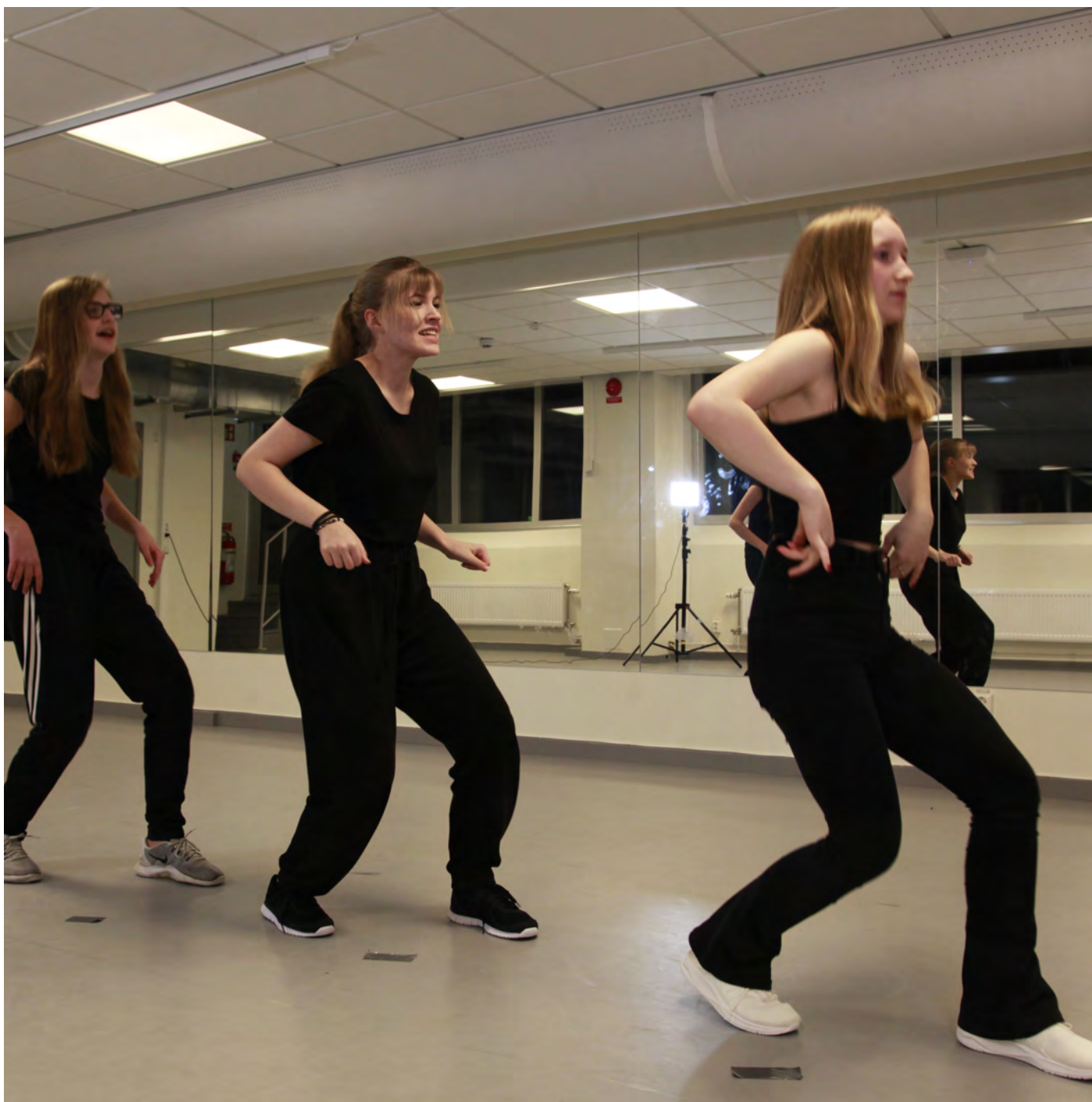
Dansklass i Huset på höjdens lokaler på Engelbrektsvägen 47 i Jakobsberg.