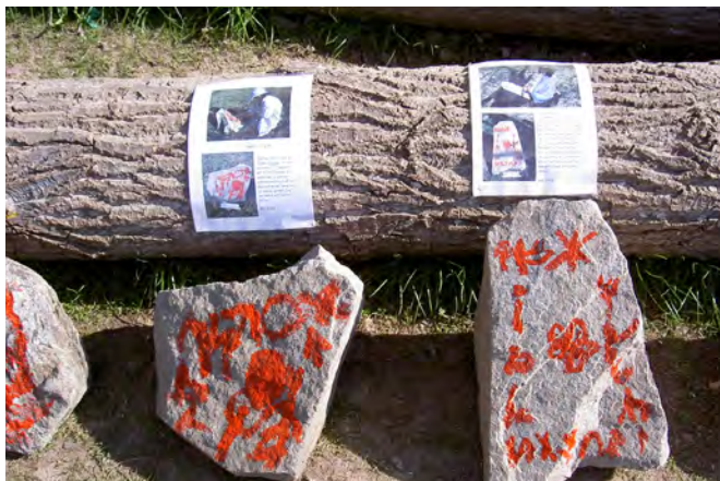
Förskolebarn på Orgona har jobbat med runor och bokstäver på temat kulturarv.

Arkivens utbud kan bidra till att uppfylla målen och kunskapskraven i läroplanen på ett ovärderligt sätt. Det arkivpedagogiska materialet som Järfälla kultur erbjuder är alltid förankrat i läroplanen och finns digitalt på bildarkivets hemsida. Ofta tas material fram tillsammans med skolan för att på bästa sätt passa det eleverna arbetar med. Exempel på teman är Demokrati & Barnkonventionen, Källkritik, Lokalhistoria, Industrialismen, Ekosystem i Järfälla och bildanalys.