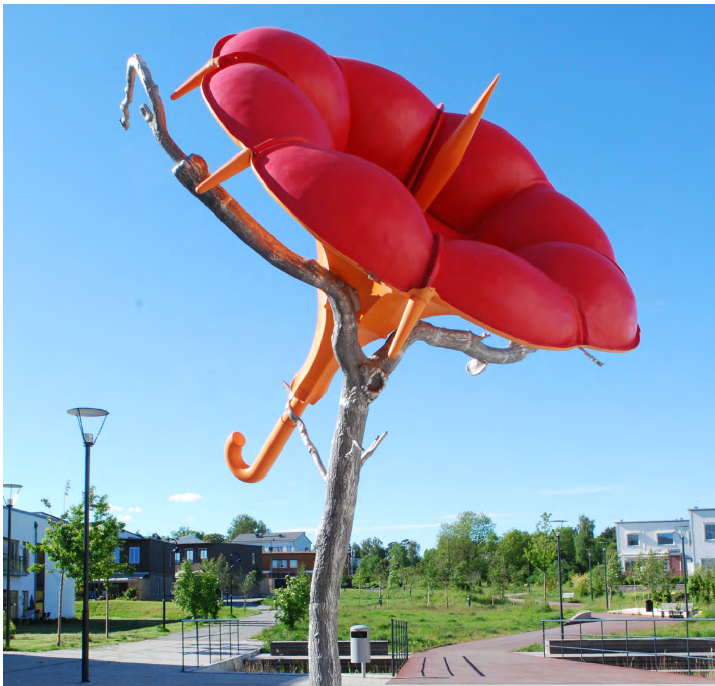
"Blown away" skulptur av Johan Paalzow, vid Ålsta torg i Barkarby.