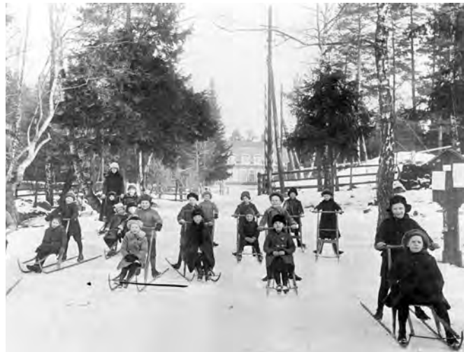
Skolelever i Kallhäll, 1920-talet.

Vidga Järfällaperspektivet och gör studiebesök på några tidstypiska platser och miljöer i Stockholm. Förhållandet förort - huvudstad - storstadsregion bör belysas. Studera samhällsplaneringsprocessen ur olika perspektiv, både ett lokalt - exempelvis från aktuella planer i Järfälla - och ett regionalt, samt se vilka olika aktörer som finns.