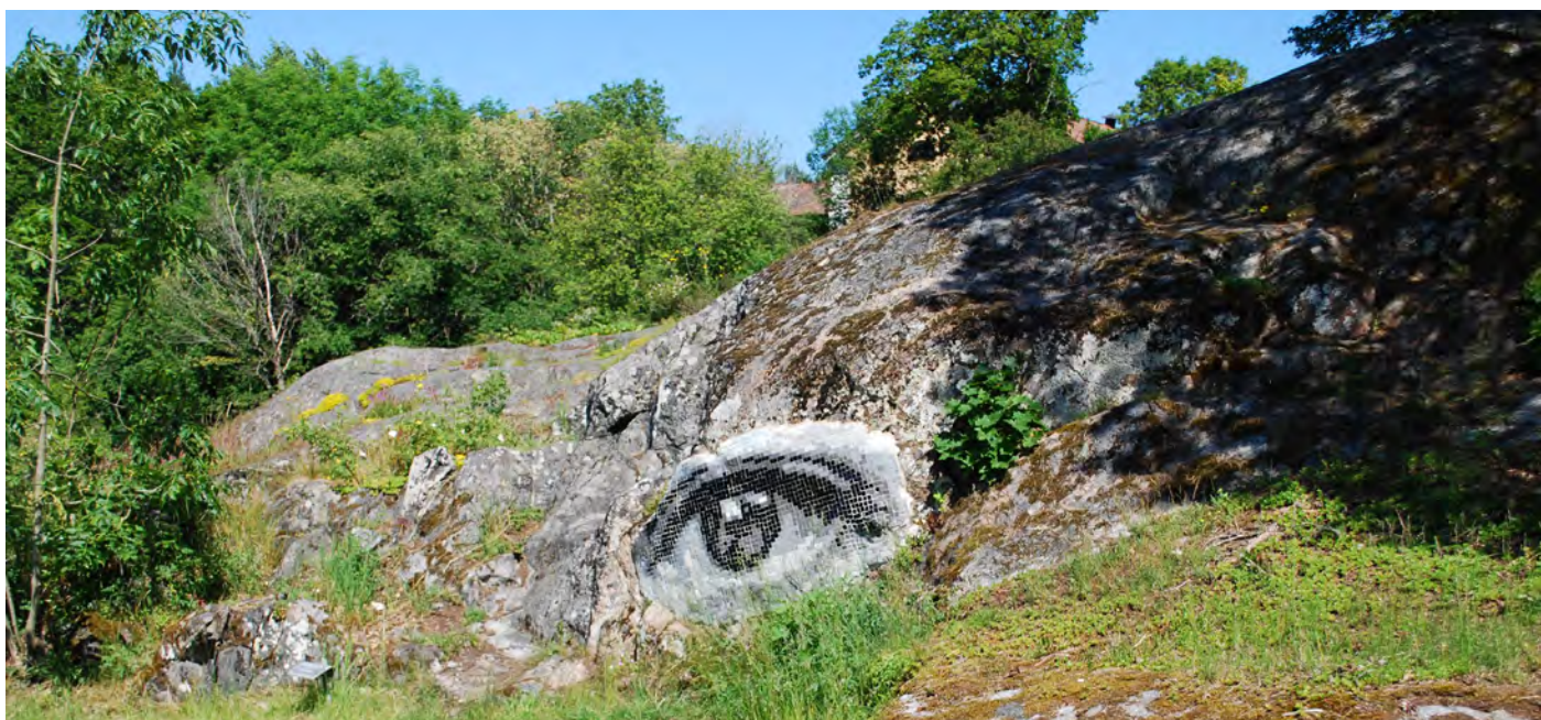
Görvålns skulpturpark. "Ögat" av Maria Ångquist Klyvare.

Konstpedagogiken Med konstpedagogiken vill vi inspirera barn att uppleva konst. Det gör vi genom aktuella utställningar i Jakobsbergs konsthall och konsthallen i Bas Barkarby. Vi ser den pågående utställningen och studerar och diskuterar konstnärens verk, bilduttryck, materialval och teknik.