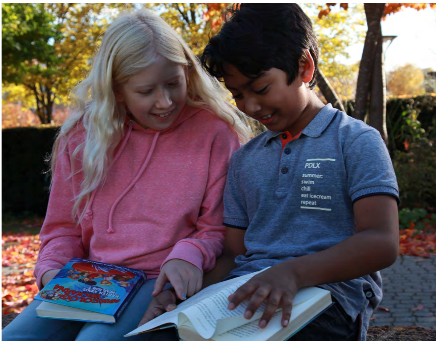
Spännande läsning i Ridddarparken.