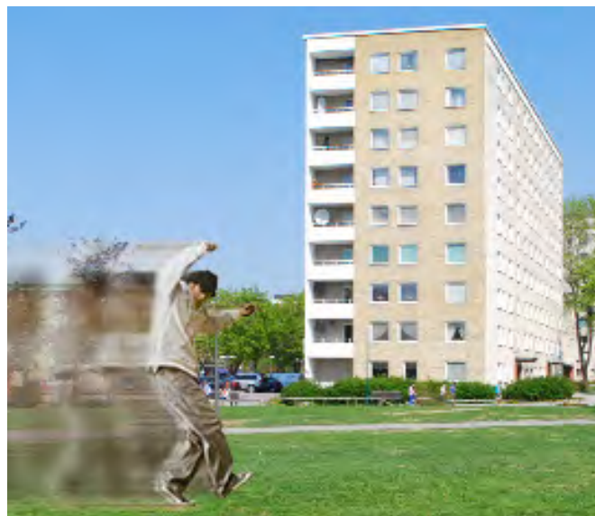
Projekt inom media är mest populärt, till exempel digitala berättelser och animerad film. Här fotomontage med bild från Drabantvägen.

Järfälla kultur har skolhuvudmannens uppdrag att ansöka, planera, genomföra, utvärdera och redovisa bidraget. Detta sker i nära samarbete med skolorna. Därigenom har skolorna också möjlighet att välja ut och koppla samman Skapande skola-projekt med kursplanerna, utifrån teman och avsnitt som de enskilda klasserna kommer att arbeta med under läsåret.