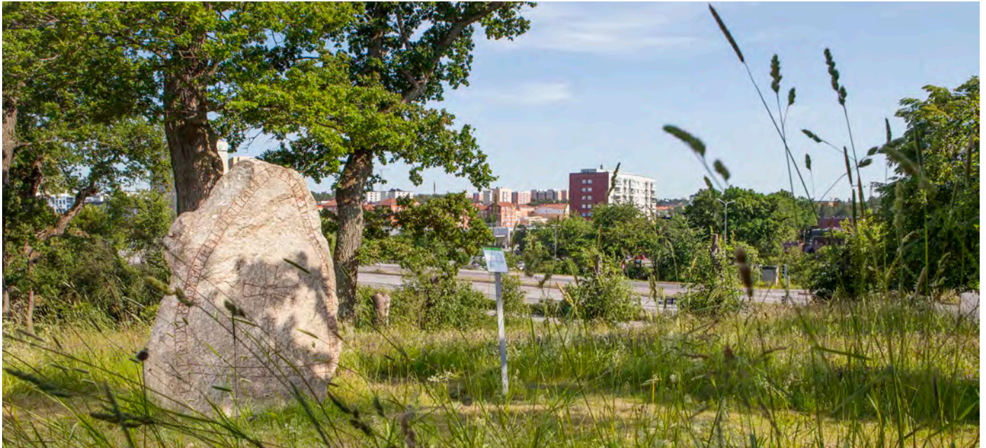
Runstenen utanför Jakobsbergs folkhögskola, Folkhögskolevägen.