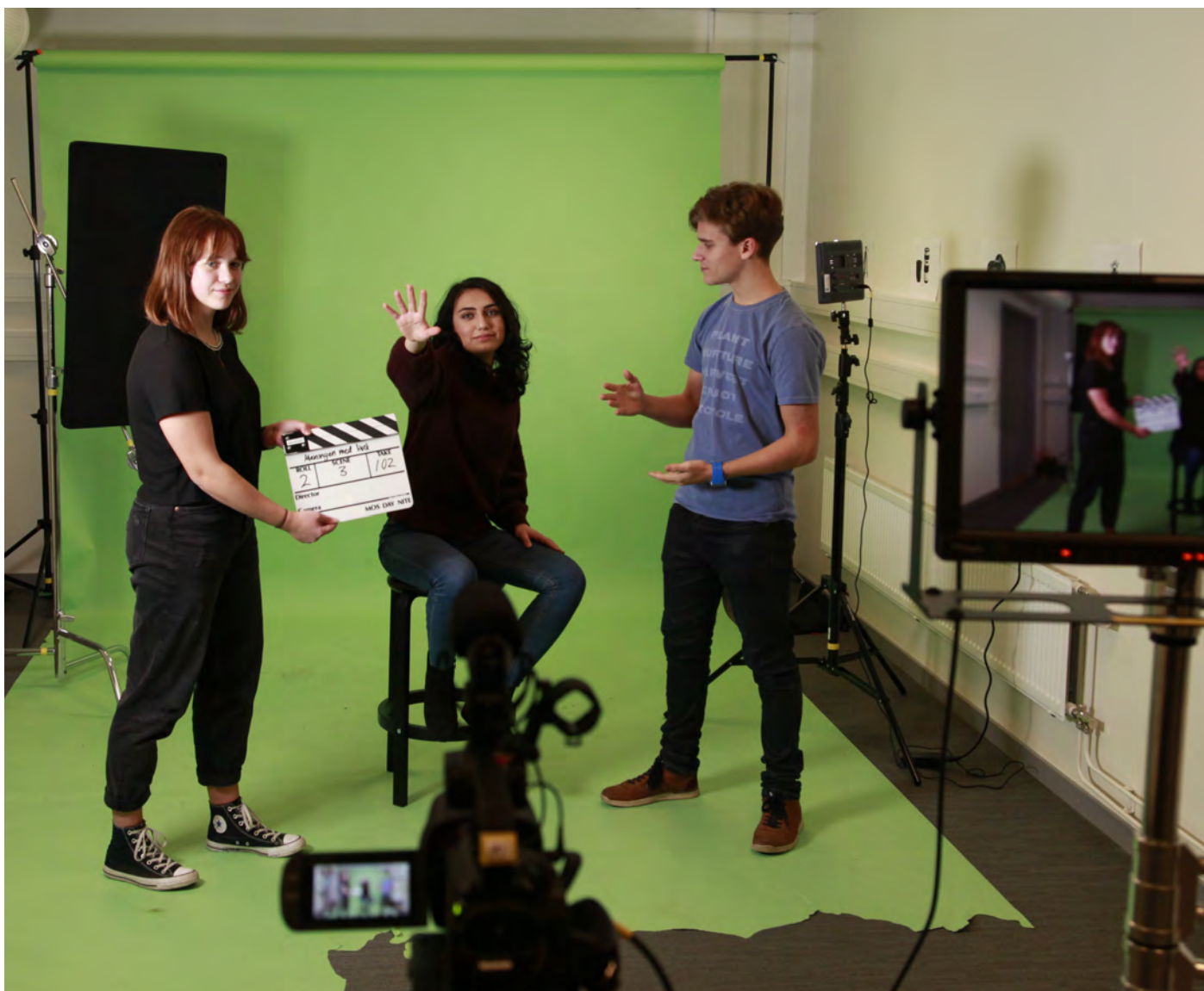
Greenscreen-bakgrund i filmstudio på Huset på höjden.