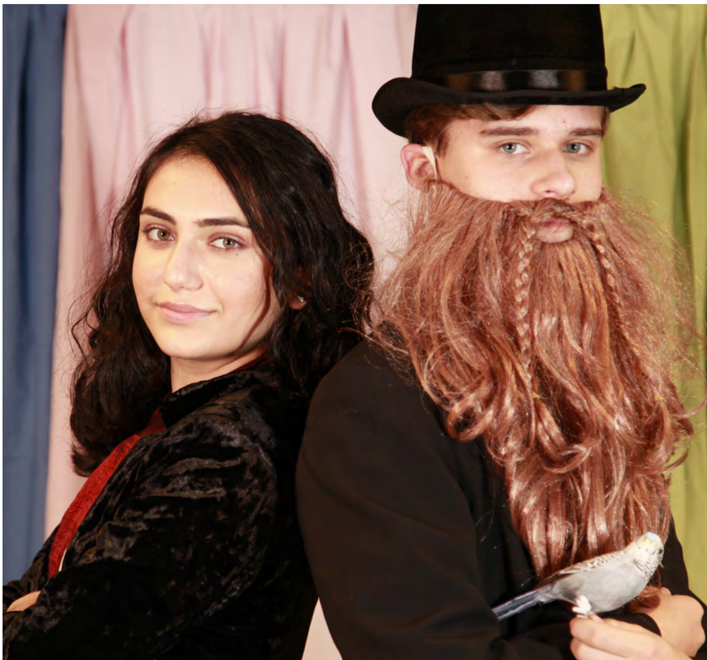
Drama med liten fågel i Huset på höjdens dramasal, Jakobsberg.