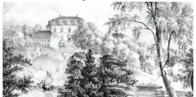
Görvälns slott, litografi från 1800-talet av Ulrik Thersner.

Undervisningen i de samhällsorienterande ämnena ska behandla följande centrala innehåll i årskurs 1–3 ... Hemortens historia. Vad närområdets platser, byggnader och vardagliga föremål kan berätta om barns, kvinnors och mäns levnadsvillkor under olika perioder. Lgr reviderad 19, s 197