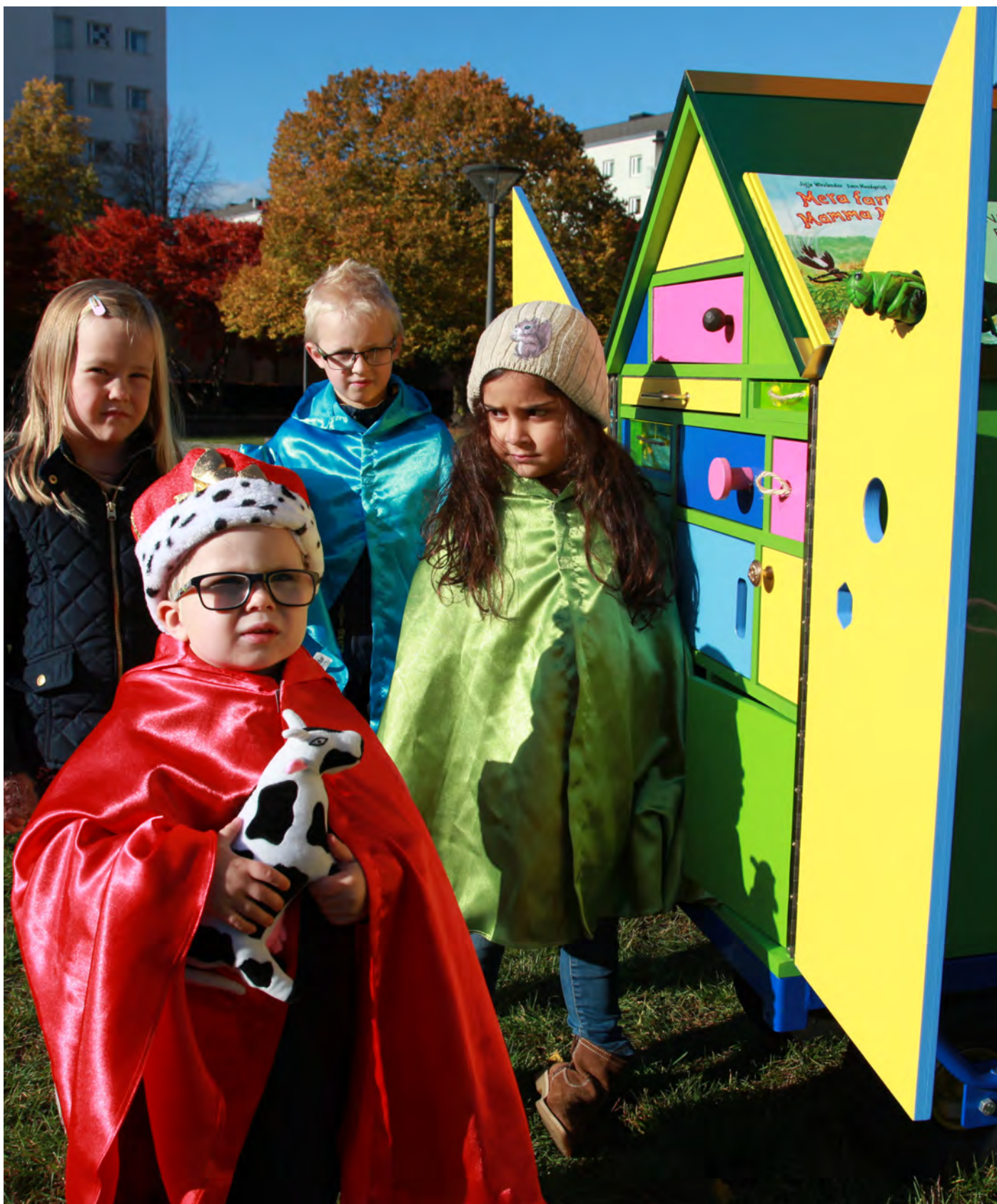
En liten kung i Ridddarparken.