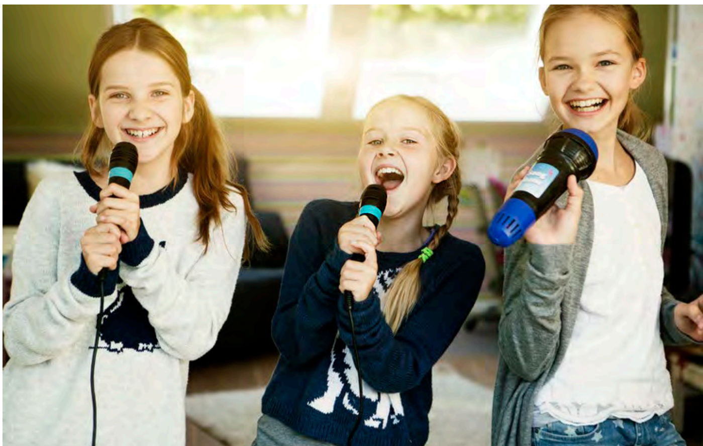
Elever ska få prova olika instrument och utveckla sin sångförmåga.