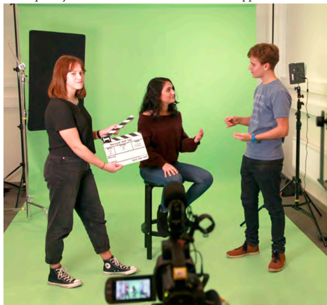
Huset på höjdens filmstudio. Arbete med filmklappa.

Kompetensutveckling för lärare på alla stadier i exempelvis filmanalys, animation, digital redigering eller andra aktuella ämnen ska kunna erbjudas av Järfälla kultur. Skolorna står för kostnaden för deltagande lärare.