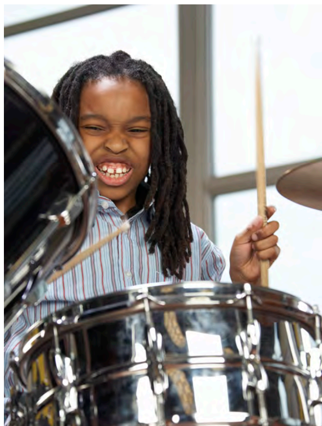
Fick du höra något trumsolo?