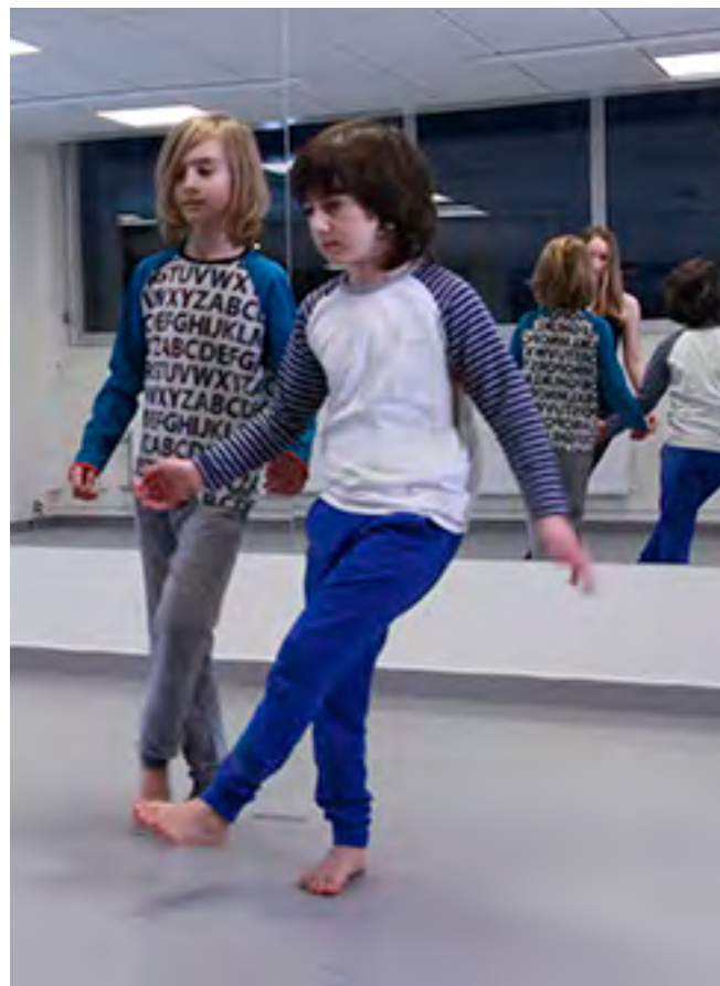
Dansklass i Huset på höjdens lokaler.

Dansimprovisation är en annan typ av dans, som till stor del bygger på att skapa för stunden och följa sin egen lust och vilja. Den utgår från individens egna förutsättningar och rörelsemönster och det finns inga rätt eller fel. Däremot kan man ge förslag på hur man kan improvisera dansen, se nedan.