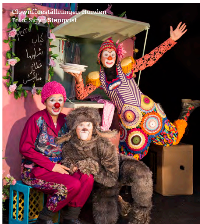
Clownföreställningen Hunden

Hur upplevde du själv teaterföreställningen?