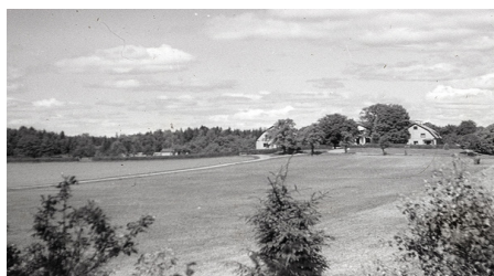
Viksjö, ur samlingen Viksjöbilder. Foto: John Lif.

Viksjö gård är en av Järfällas äldsta gårdar - den finns omnämnd redan på 1000-talet, på en runsten som "Knut i Vikhusum lät resa. Runstenen finns idag i parken vid Jakobsbergs folkhögskola. Flera gravfält undersöktes när Viksjö skulle exploateras. Fynden visar att Viksjö var