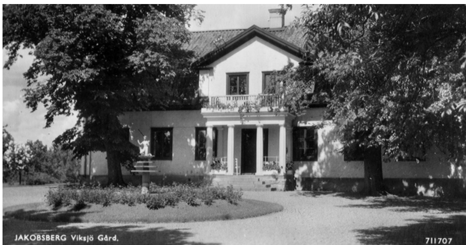
Viksjö gård, vykort från 1940-talet.