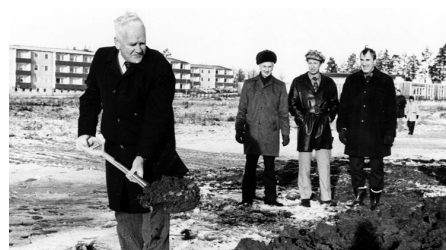
Första spadtaget för Viksjöskolan 1973.

bebott redan under vikingatiden. Under 1500-talet fanns två gårdar i Viksjö. Båda ägdes av adliga personer som arrenderade ut dem. Utbyggnaden av Viksjö dröjde till 1960-talet. Viksjö planerades utifrån bilismen. Ett stort köpcentrum byggdes centralt. Två större genomfartsvägar leder till och från området. I övrigt är det återvändsgator, för att minska bilismen bland bostadshusen. För fotgängare och cyklister finns ett stort gång- och cykelvägsnät.