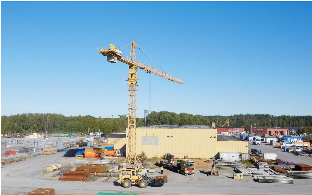
Detta är en bild på Wiklunds anläggning i Bro (SOT).

Wiklunds Åkeri AB [Projektets namn] Skällstavägen 9 197 40 Bro [Godsmottagares namn och tel]