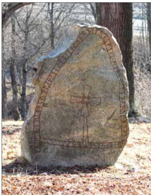
En av runstenarna vid Jakobsbergs gård

undersöka och gräva ut en fornlämning eller vidta andra åtgärder lämnas av länsstyrelsen. Länsstyrelsen kan också besluta om att en arkeologisk utredning ska göras för att ta reda på om fasta fornlämningar berörs av en planerad exploatering. Om fornlämningar berörs och exploatören önskar fullfölja arbetsföretaget är det exploatören som får stå för kostnaderna för att undersöka och ta bort fornlämningarna. Förutom redan kända fornlämningar så omfattas även hittills okända fornlämningar och fynd av lagen.