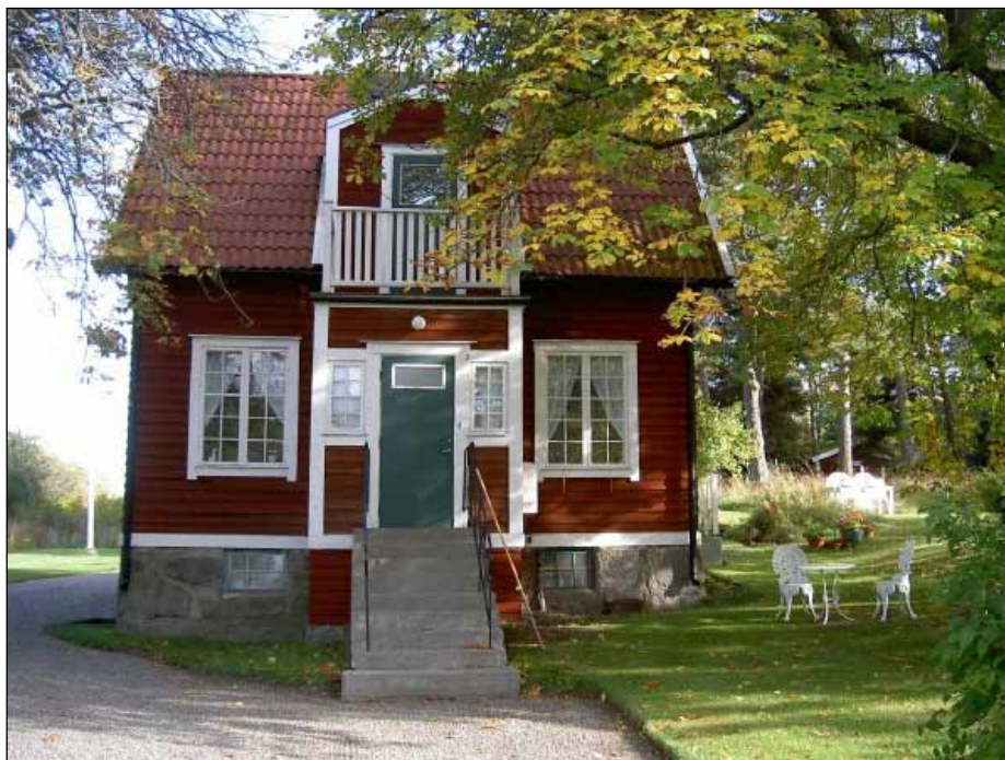
Arneska villan i Tingsbyn, Barkarby