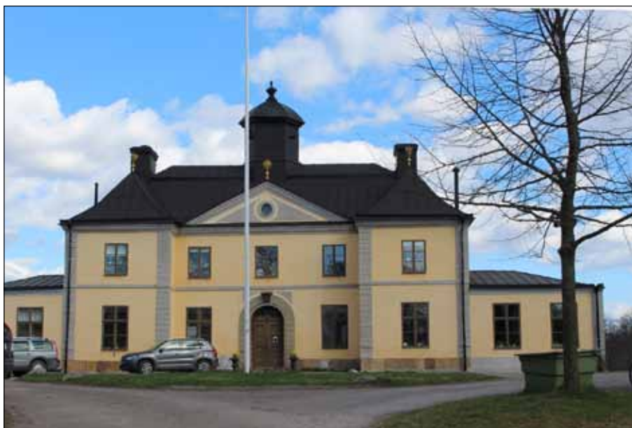
Säby gård vid Järvaftet

Miljöbalken trädde i kraft den 1 januari 1999 och ersatte då en rad befintliga lagar, bland annat naturresurslagen. Dessutom finns ett antal lagar som är knutna till miljöbalken, exempelvis plan- och bygglagen. I balkens mål sägs att vi ska främja en hållbar utveckling, att vi och kommande generationer ska ha en god miljö, att naturen har ett eget skyddsvärde