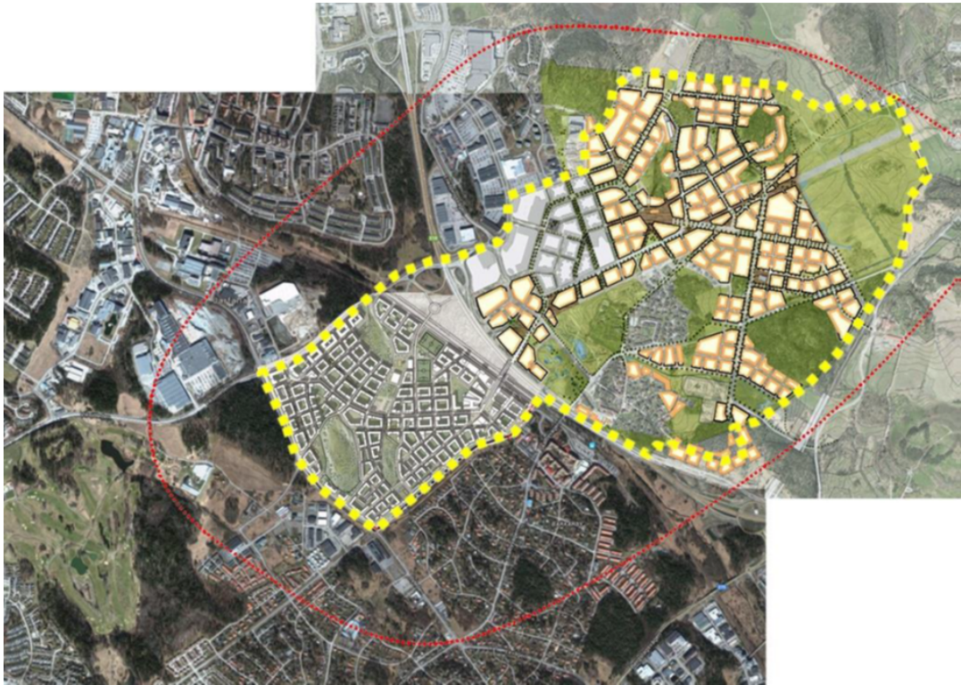
Fig 2 Tunnelbanans nuvarande influensområde markerat med rött.

Influensområdet kan komma att utökas och då kommer uttag av medfinansieringsersättning att göras inom ett större område.