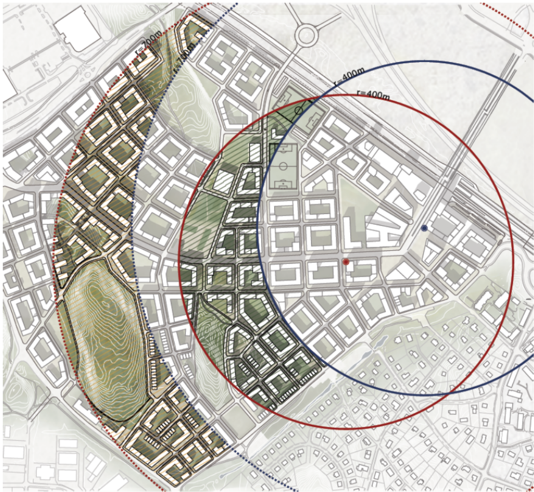
Fig 1 Stationsuppgångarna i Veddesta.

Kommunfullmäktige beslutade den 12 juni 2017 §84 om ett tilläggsavtal till genomförandeavtal för tunnelbanan gällande finansiering av en ytterligare stationsuppgång i Veddesta. Avtalet innebär att Järfälla betalar 91 miljoner kronor till den nya stationsuppgången vid Veddestavägen. Genom beslutet fastställs att bidrag till tunnelbanan ska betalas av de exploatörer som kan förväntas få ett ökat värde till följd av tunnelbanans tillkomst. Nya byggrätter vilka är belägna inom 400 meter från tunnelbaneuppgång ska bidra med 700 kr/kvm BTA, nya byggrätter belägna inom 401-700 meter ska bidra med 350 kr/kvm BTA.