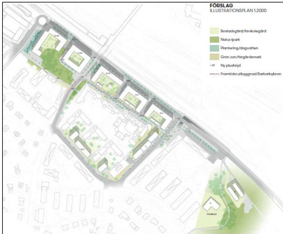
Figur 2. Planskiss för den nya detaljplanen.

Syftet med detaljplaneutredningen är att pröva möjligheten att tillföra bostäder, centrumverksamhet och infrastruktur i området (Figur 2). Bebyggelsen ska innehålla drygt 10 000 m 2 bostäder samt en blandning av funktioner.